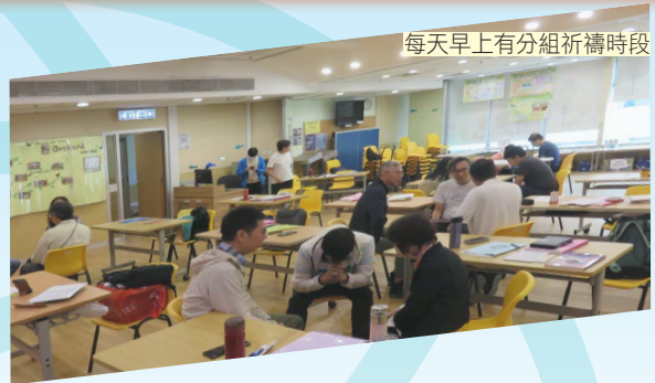
每天早上有分組祈禱時段