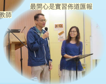
最開心是實習佈道匯報