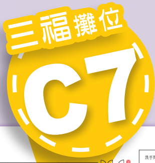
第四十屆基督教聯合書展場地平面圖