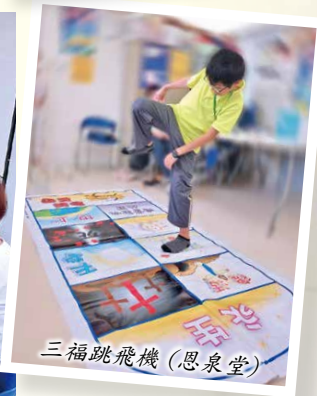
三福跳飛機(恩泉堂)