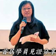
首屆學員見證分享