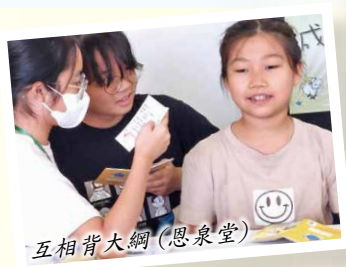
互相背大綱(恩泉堂)

十分感謝天父，讓我今年在暑期聖經班，能夠被編入「兒童三福班」，因為這個班是基督的精兵。我本來挺興奮的，但後來擔心要背誦很多經文，自己應付不來。然而，當導師在課堂上對經文作出詳細講解，及用不同的手工和故事傳達意思，讓我們記得更深刻後，對經文的背誦也就沒那麼困難了。